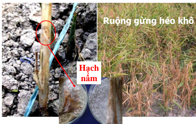
Hình 7. HÉO KHÔ do nấm Sclerotium sp.