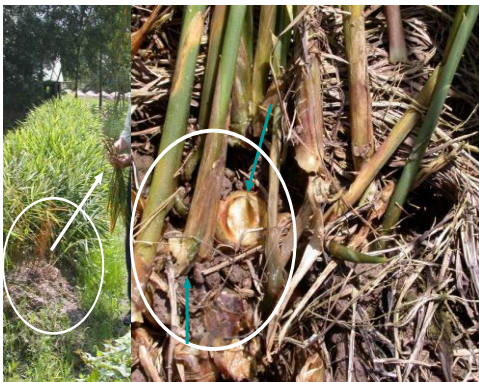
Hình 1. BỆNH THỐI NHŨN do vi khuẩn Erwinia carotovora