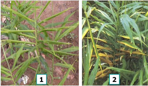
Hình 3. HAI DẠNG BỆNH HÉO CÂY- THÓI CŨ do vk. Pseudomonas solanacearum : (1) héo xanh (chết nhanh), (2) héo vàng (chết nhanh/chậm)