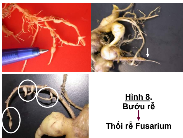
Hình 8. Bướu rễ ↓ Thối rễ Fusarium