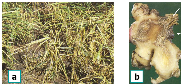
(a) Thiệt hại ngoài đồng: Cây lùn, kém phát triển, lá vàng rụi rồi chết héo; (b) Củ: Thối nâu trong củ, phần củ bệnh bị nhăn nheo, teo tóp lại, và có phủ nấm trắng.