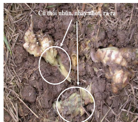
Hình 2. BỆNH THỐI NHŨN do vi khuẩn E. carotovora