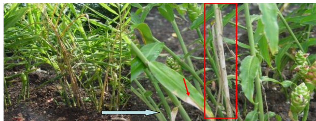
Hình 6. HÉO CÂY - CHÁY LÁ - THÓI GÓC do nấm Rhizoctonia solani